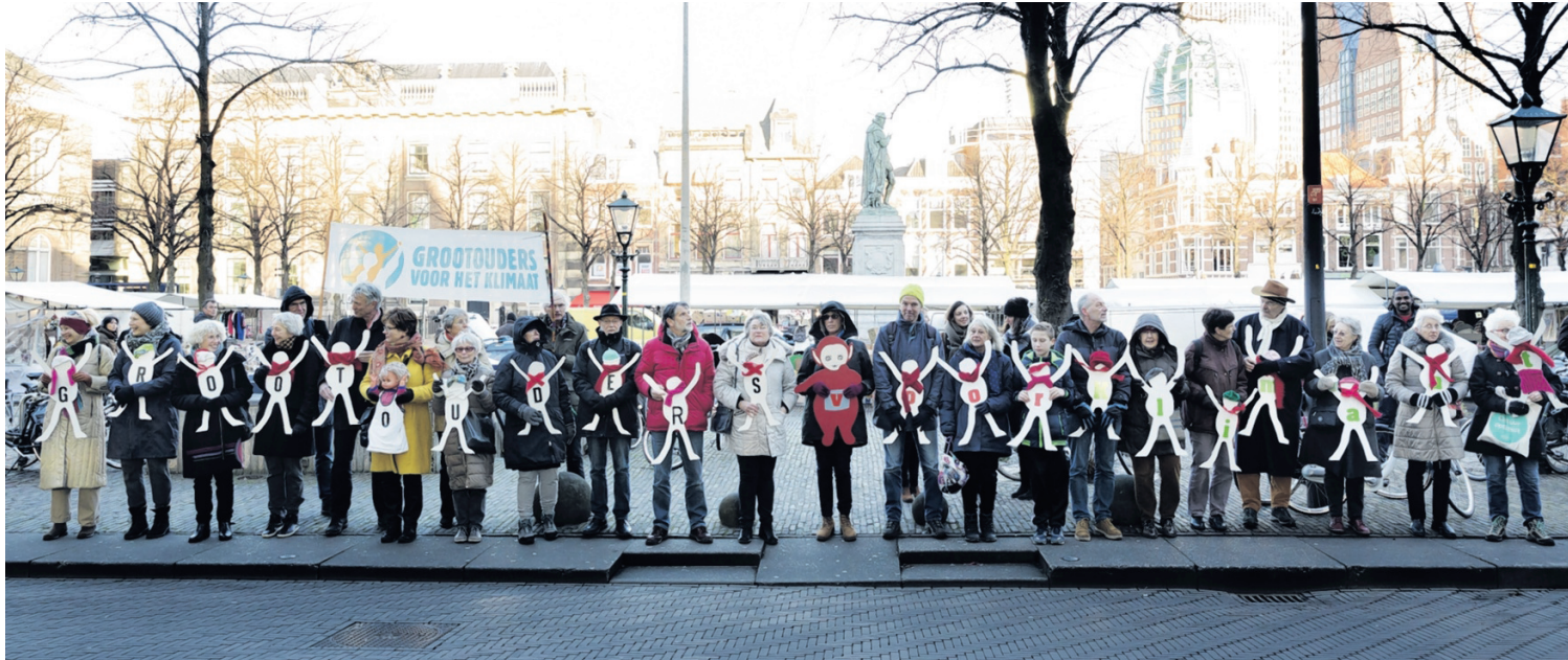
De 'grootouders voor het klimaat' demonstreren twee keer per maand op Het Plein in Den Haag.